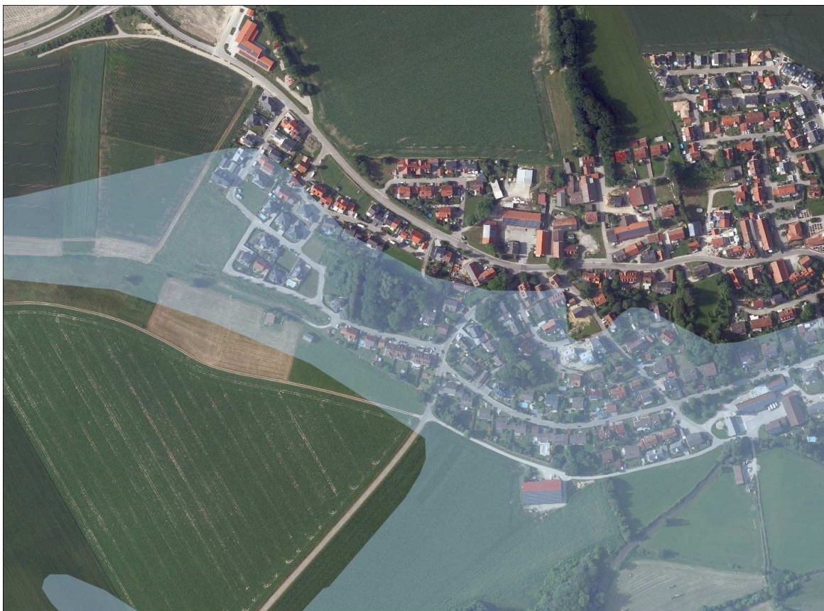
Wassersensible Bereiche bei Egenburg

Im Änderungsbereich bestehen keine Oberflächengewässer. Der Planungsbereich befindet sich innerhalb wassersensibler Bereiche. In dieser Geländerinne verläuft südlich der Siedlungsflächen ein Graben.