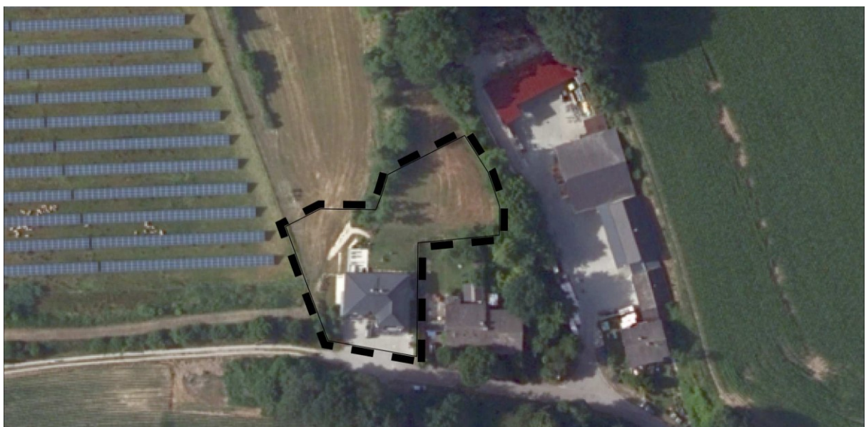
Luftbild der Bestandssituation (© Bay. Vermessungsverwaltung 2022, unmaßstäblich) mit dem Änderungsbereich